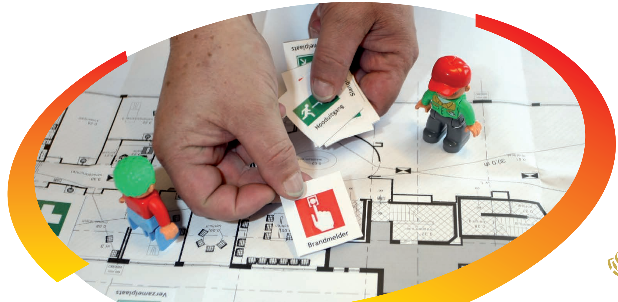
Table-topoefening: ontruimen in het klein