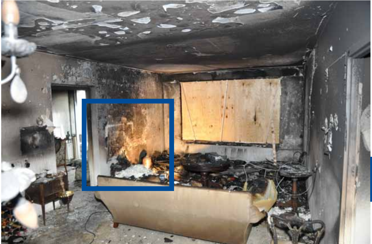
Linksachter in woonkamer stond de televisie.