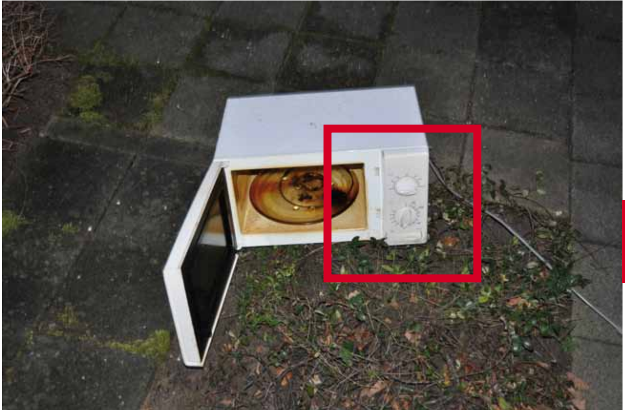
Magnetron met zichtbare rookschade.

Keukenbrand / rook door vergeten voedsel in magnetron.