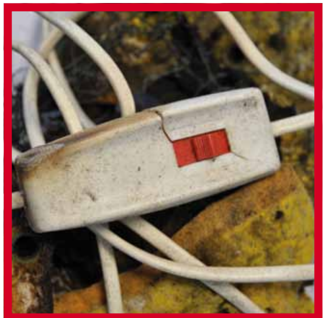
Schakelaar elektrische deken in hoogste stand.