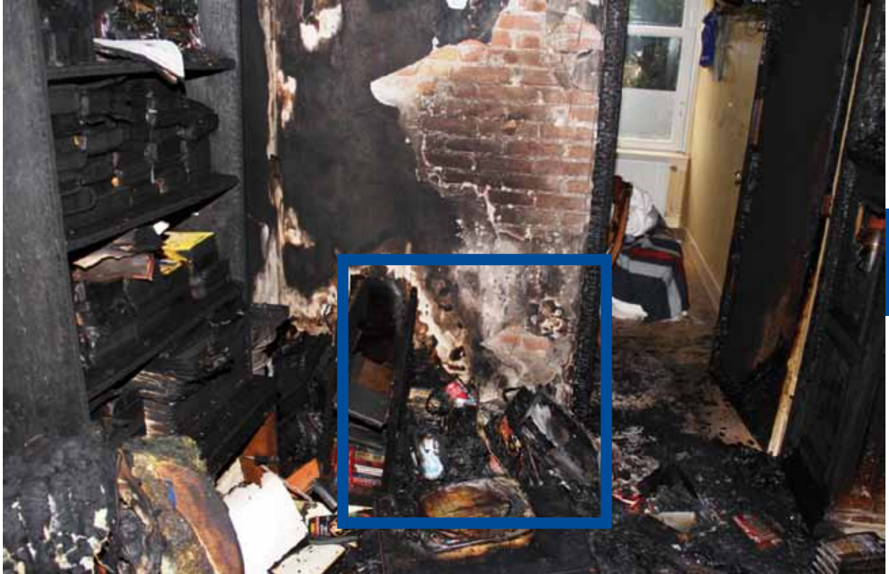
Hoek van ontstaan