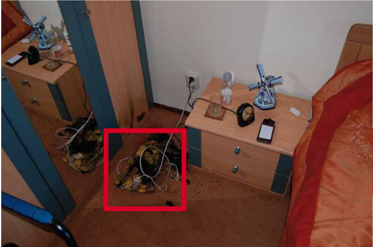
Elektrische deken met stekker in stopcontact.