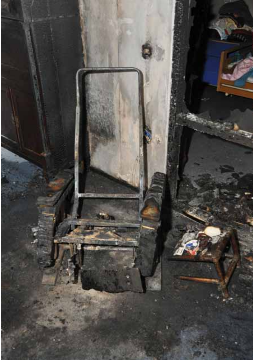
Resten van (elektrische) stoel met sta-op hulp