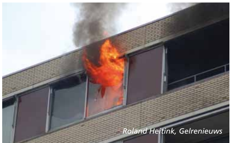
Televisie en televisiemeubel staat in brand.