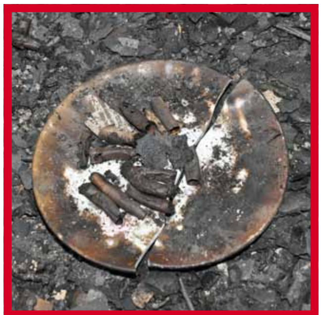
Schoteltje op nachtkastje waar de bewoner de peuken op legt.